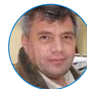
Perino BARAGA "Digital & Smart Hub" PETAL